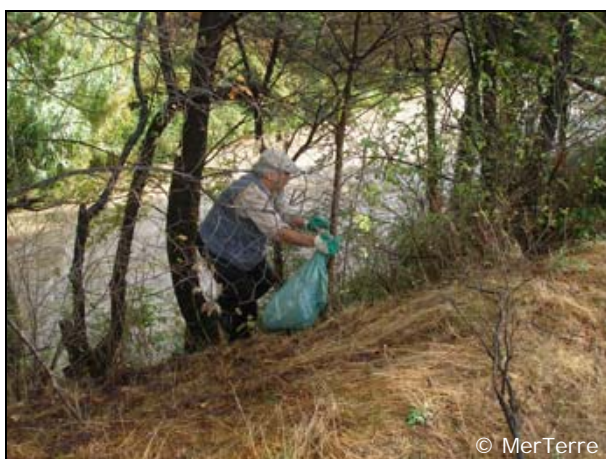
Des conditions de nettoyage difficiles parfois.