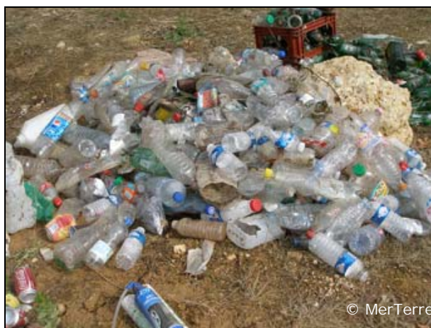
Les bouteilles en plastique sont toujours en quantité importante parmi les macrodéchets.