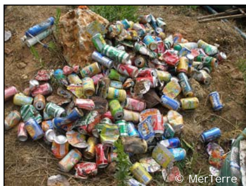
Canettes en aluminium de soda divers et de bière.