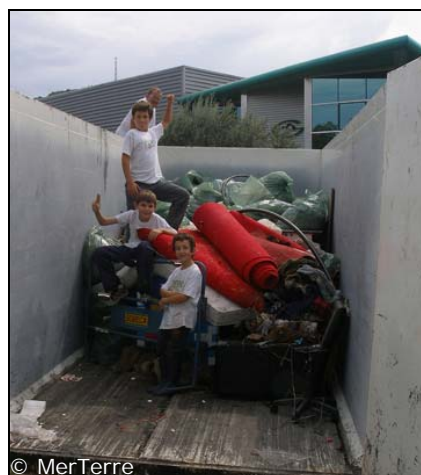
Résultat du nettoyage