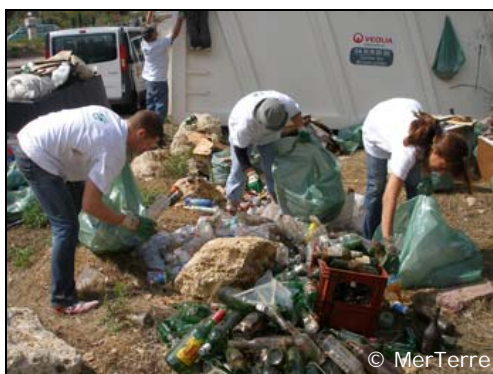
Comptage des déchets d'emballages.