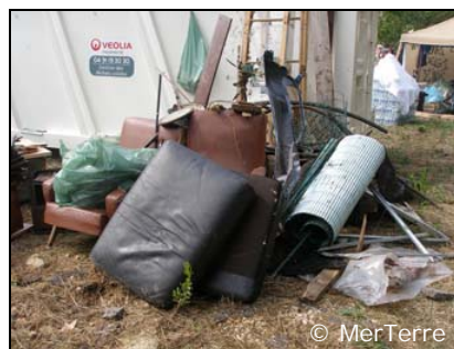
Fauteuils, coussins et autres déchets divers.