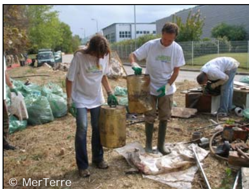
Bidons d'huile de 50 l