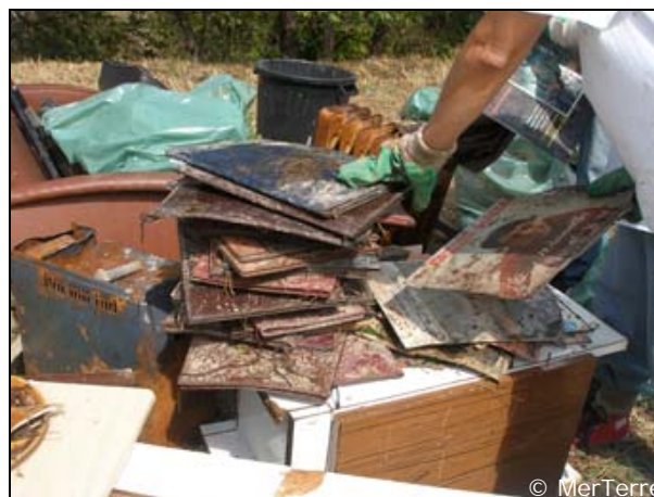
33 menus de restaurants et vieux 33 tours en vinyle.