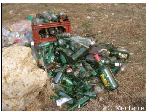
Les bouteilles en verre sont essentiellement des bouteilles de bière, de vin et d'alcool plus fort.