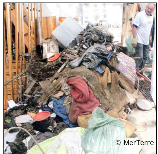
Photo 6. Un tas de vêtements et tissus en tous genre représentant environ 5 m3.