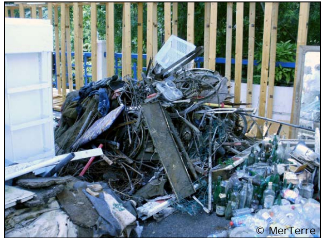
Photo 2 et 3 . Ferraille et déchets d'électronique