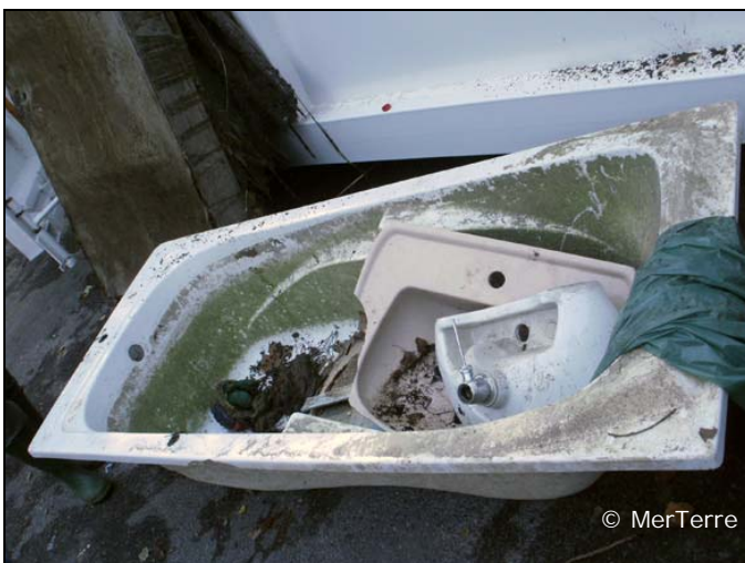
Photo 5. Une baignoire et deux éviers en céramique.