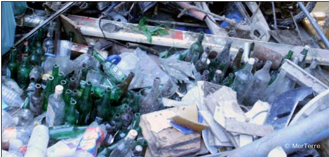
Photo 4. Les nombreuses bouteilles en verre retirées des berges.