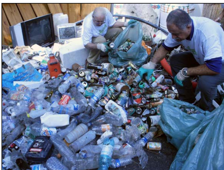
Photo 1. tri des déchets d'emballage en aluminium et en plastique. Les bouteilles plastiques et les canettes en métal représentent toujours une part importante des déchets ramassés sur les berges de l'Huveaune.