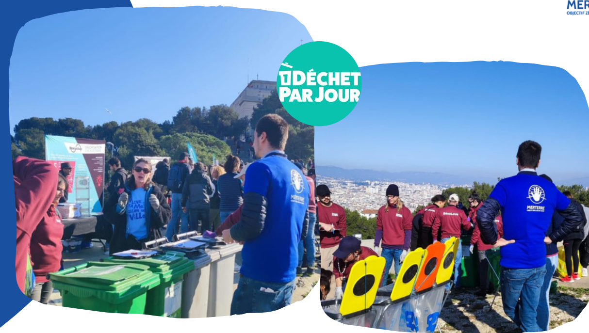
Soutien à 1 Déchet par Jour dans le cadre de l'opération Love Ta Bonne Mère autour de Notre-Dame de la Garde à Marseille

Depuis sa création, MerTerre a tissé des liens de confiance avec des structures des territoires de la Région Sud en coordonnant ou en accompagnant des nettoyages d'envergure. Nous proposons d'accompagner les structures organisatrices pour la coordination de leur événement, l'organisation des ramassages , les besoins matériels , les formations à la caractérisation et pour l'inscription de leur événement et la saisie des données sur la plateforme ReMed Zéro Plastique .