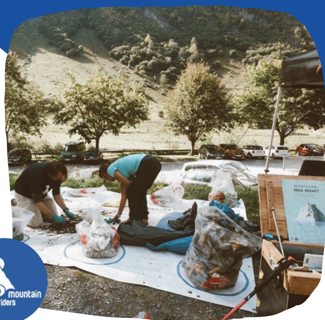
Soutien à Mountain Riders dans le cadre de Montagne Zéro Déchet dans de nombreuses stations de ski, des Alpes au Jura