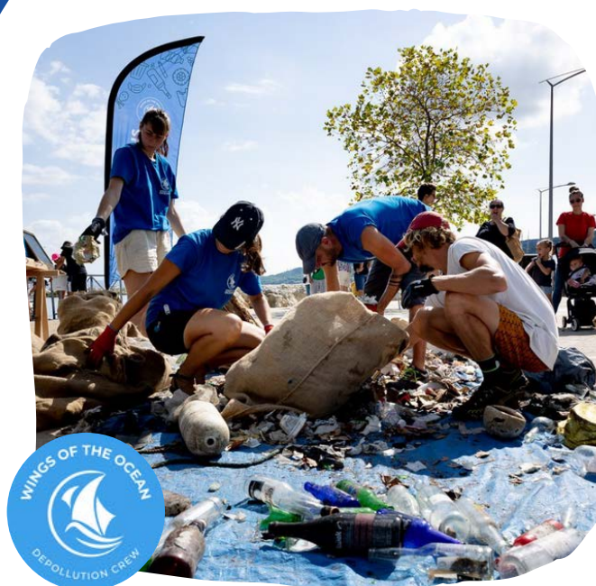
Soutien à Wings of the Ocean dans le cadre de la mission Étang de Berre et de leurs autres dépollutions