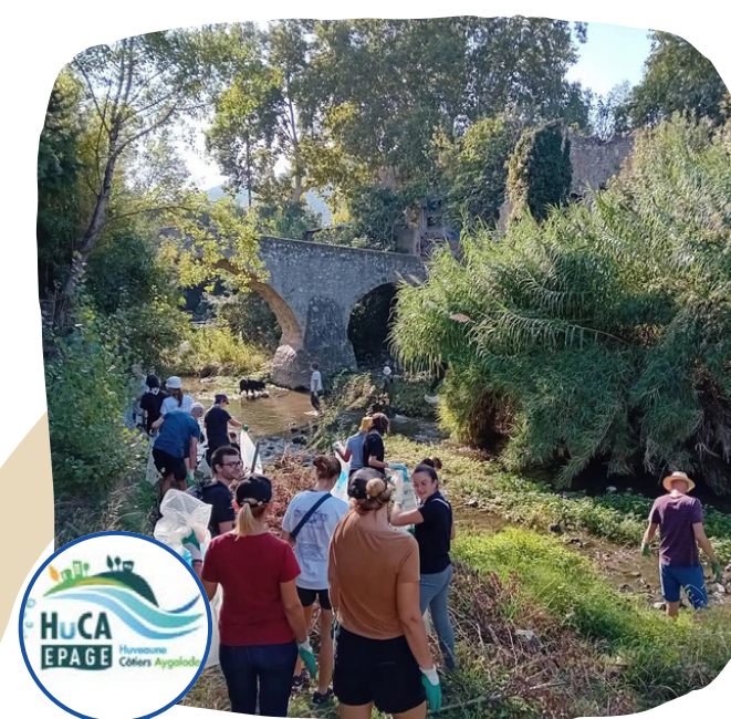
Soutien à l' EPAGE HuCA dans le cadre de Rivières Propres sur le fleuve de l'Huveaune