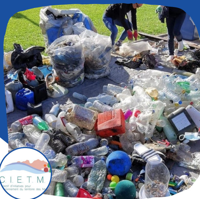
Soutien au CIETM dans le cadre de Provence Propre sur le littoral varois en passant par les terres